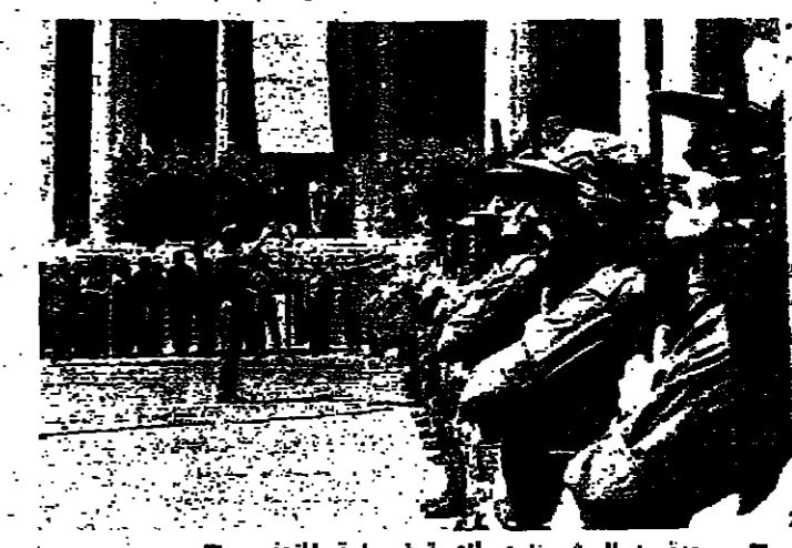
وحدة من الجيش تؤدي التحية في ساحة النصب

وكانت الاحلام اللبنانية في اثناء الاحتفال ترفرف في سماء الساحة وجوانبها ، والجواهر محتشدة على الارصفة وعلى شرفات المباني المجاورة ، مشاركة جيش لبنان في عيد الوطن . وعند الساعة الواحدة بعد الظهر تم قائد الجيش العميد الركن فكتور خوري بزيارة فتهلة كترئيس الياس سركيس يرافقه وفد من الضباط السادة : العميد منير طريه رئيس الاركان ، العميد الركن اليسر منير المعلوم الاداري لرئيس الاركان ، العميد الركن زين مكي معاون رئيس الاركان ، العميد الركن البكري فاروق رئيس الشعبة الاولى ، العميد الركن انطوان لحد قائد التطعيم رقم ٣ ، العميد الركن مختار مزويدي قائد منطقة بيروت ، العميد الركن جيل مكرون مدير الرقابة الادارية ، القيد ميشال خوري قائد منطقة البقاع ، القيد اميل لحد رئيس الاركان الشخصية ، الرائد الطيار محمود رئيس الشعبة الخامسة ، القيد فري غازي الامين العام ، القيد هادي عيسى والتقيب عدنان شعبان عن الشعبة الثانية . وقد اقيمت احتفالات بمناسبة في مختلف المناطق .